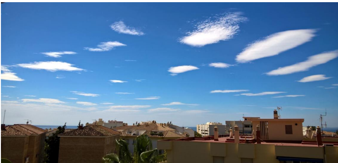
Udsigt fra terrassen ud over Marbellas tage og Middelhavet i baggrunden