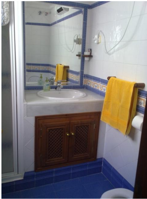
Det blå badeværelse med brusekabine