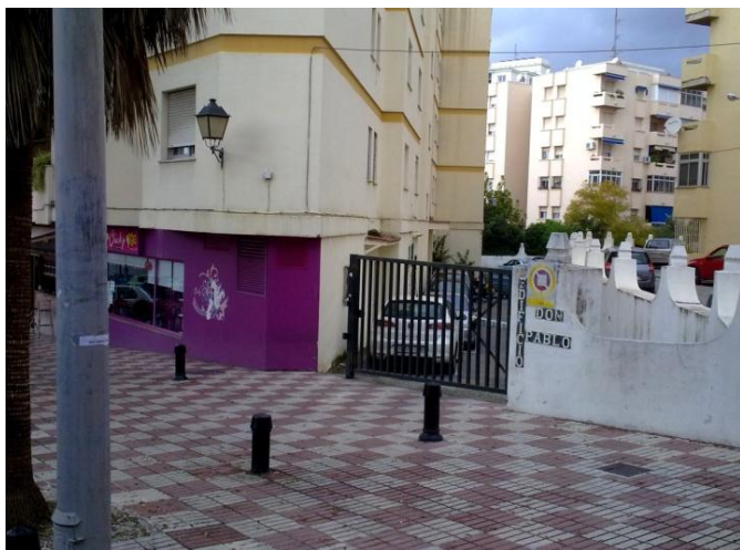
Indkørsel til parkeringsgård og opgang