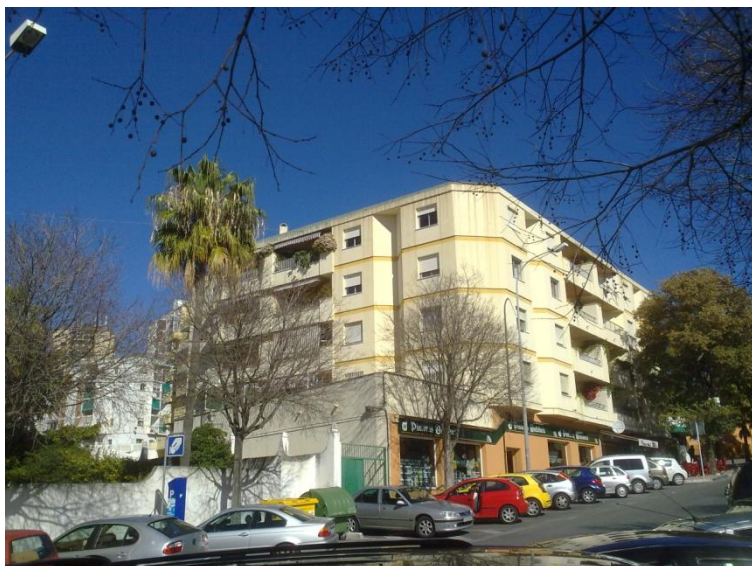
Lejligheden øverst oppe.