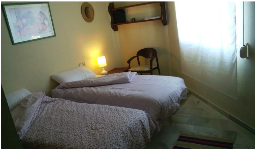
Ekstra værelse med 2 senge