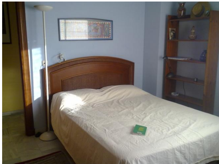
Master bedroom med indbyggede skabe